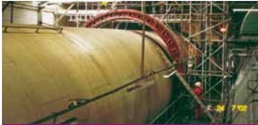
Suministro y reemplazo de pistas a la salida de una difusión RT