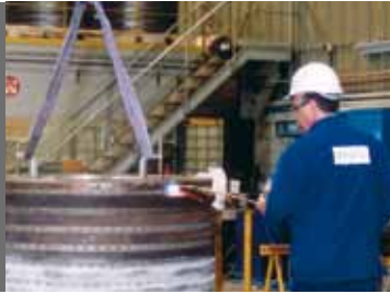
Después del peritaje, reparación de una canasta de centrífuga de bache