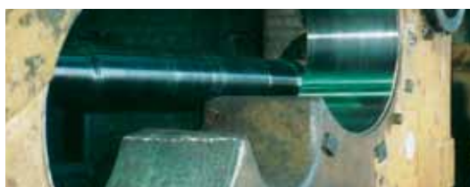
Un mandrinado terminado de maquinar