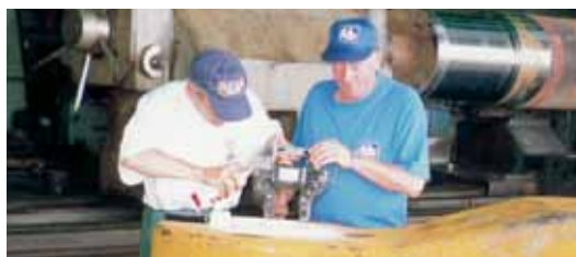
Magnetoscopia antes del pre-maquinado y soldadura