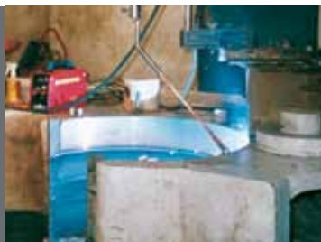
Molino en proceso de rehabilitación: recarga de un bastidor por soldadura en automático