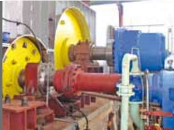
Desfibradora pesada en línea de 620 tch - BRASIL