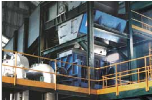
Desfibradora Vertical de 312 tch - FILIPINAS