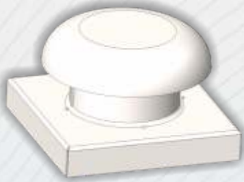
Tipo Hongo AF