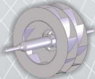
Rotor y Flecha Entrada Doble

Se fabrican de diversos materiales además del acero como puede ser acero inoxidable, aceros especiales, etc.